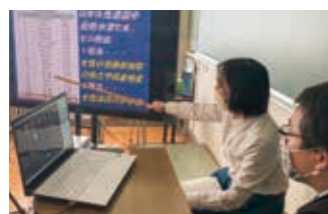
デジタル教育も積極的に活用

本校は少人数ながら部活動や年間行事も活発で、特に野球部は甲子園出場3回の道立強豪校です。ぜひ学びと共に楽しい思い出もつくり、充実した365日を過ごしてください。