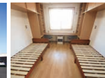
全室2名ずつの入寮