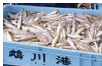
ししゃもは貴重な地域題材