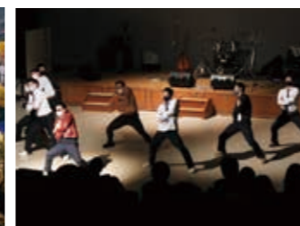
盛り上がる学校祭