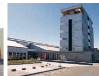
道の駅「四季の館」(宿泊・温泉施設有)