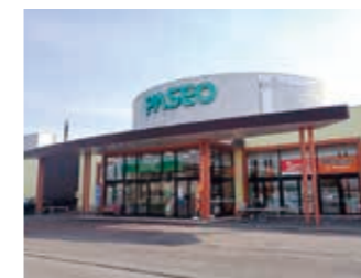
コープさっぽろ パセオむかわ店