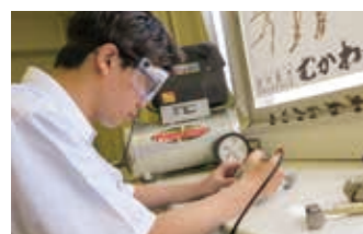
最新の化石クリーニング機を導入