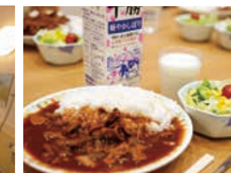
栄養バランスを考えた食事